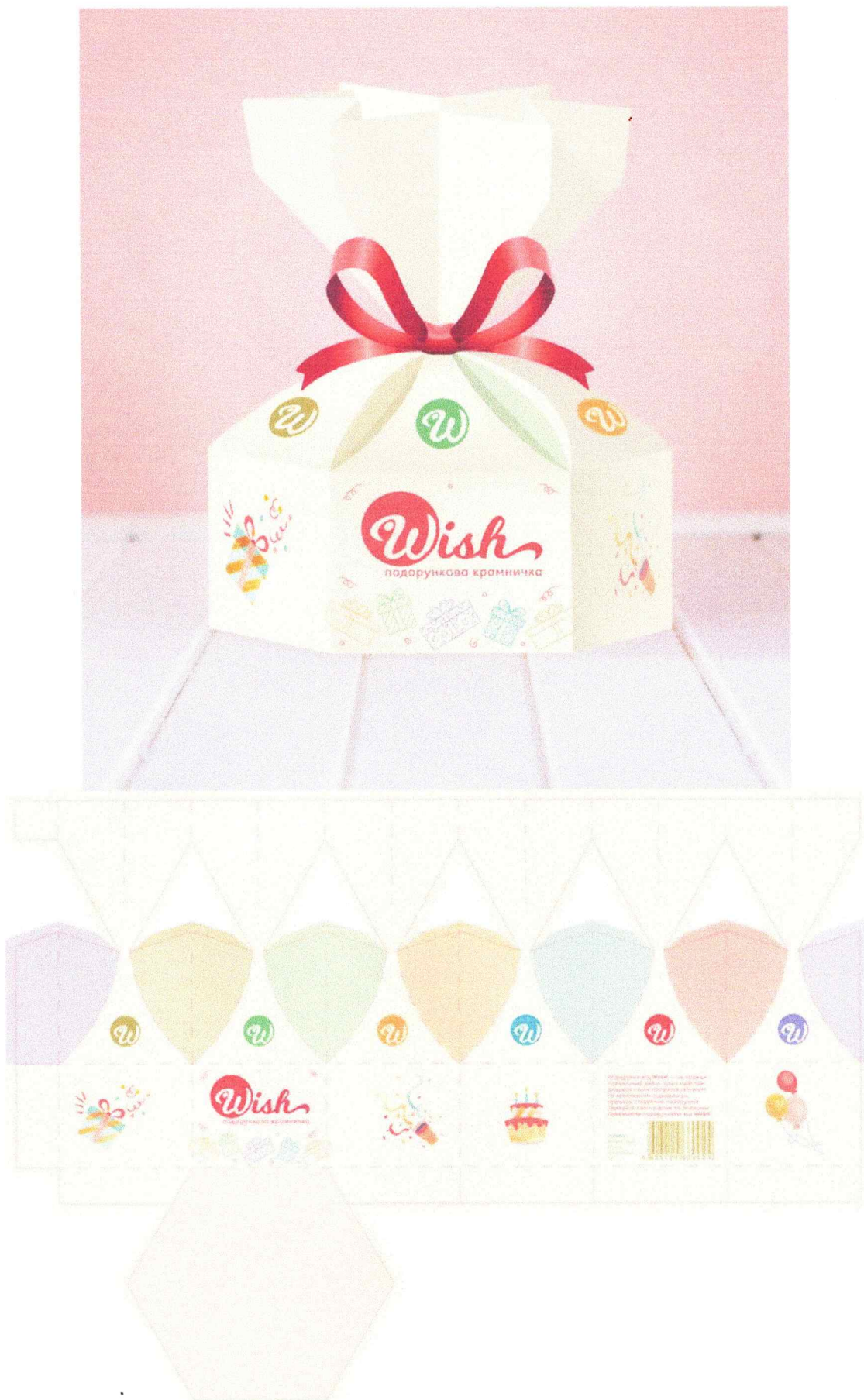
Приклад виконаного завдання з графічного оформлення упаковки (Зберегти графічний файл зображення не менше ніж 500x500 пікселів)