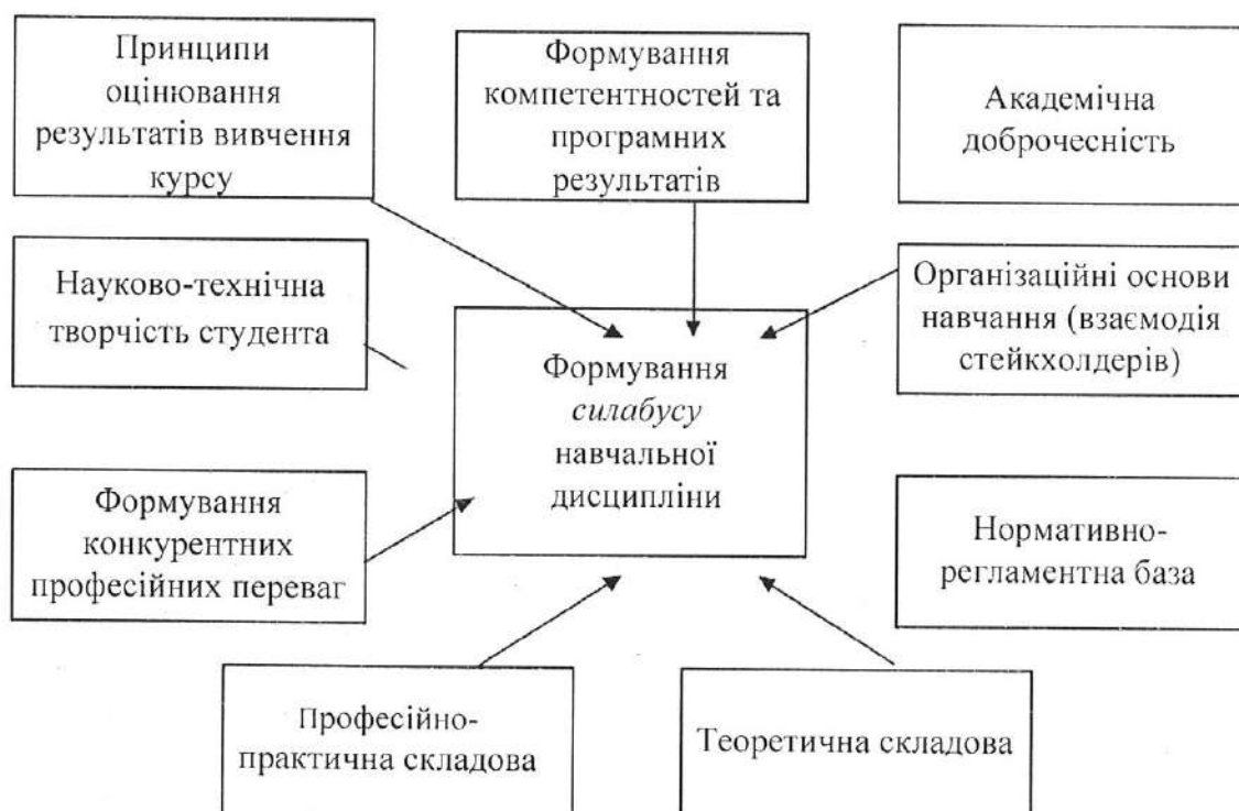
Рис. 1. Силабус навчальної дисципліни в розрізі складових

Силабус, як узагальнення змісту навчальної дисципліни, повинен бути коротким і зрозумілим для студента, тому його побудова має максимально відповідати на запитання студента про навчальну дисципліну і, водночас, відображати необхідні складові та їх взаємозв'язок. З цією метою силабус розглядається в розрізі складових (рис. 1).